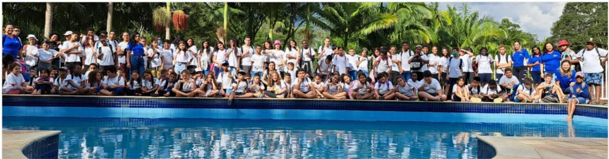
Gruppo dei NOSTRI bambini/e de' la CARICA dei 600+1! con gli educatori, ospiti nella chácara (casa di campagna) di un amico e benefattore, che ha voluto regalare una giornata speciale, con diritto al pranzo e alla merenda e... a molta allegria, in uno spazio esuberante nella natura, rallegrata dalla sempre gioiosa e vivace presenza dei piccoli! A questa iniziativa - a gruppi - parteciperanno tutti i 1000 e più bambini de' la CARICA dei 600+1 dei nostri 4 Oratori quotidiani.

È pertanto attraverso il nostro essere dono che suscitiamo il dono della gratitudine , di quel grazie che apre i cuori alla speranza, realizzando le attese di chi è nel bisogno e di chi si fa aiuto e sostegno. È il coinvolgimento dei cuori di tutti (benefattori e beneficiati) nella sorpresa della gioia, proprio perché dove c'è fraternità, lì c'è la benedizione del Signore e la sua presenza che unisce in comunione di spirito.